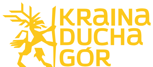
WERSJA JEDNOKOLOROWA (ŻÓŁTA)