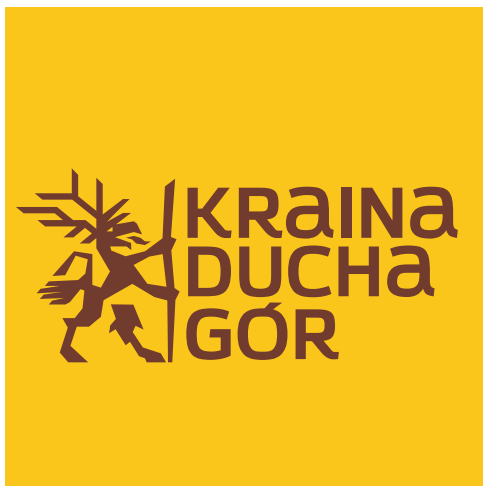
WERSJA UŻYCIA LOGA NA ŻÓŁTYM TLE