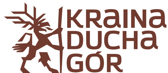
WERSJA JEDNOKOLOROWA (BRĄZOWA)